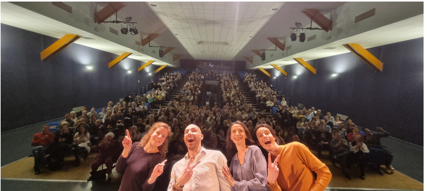
Espace Horizon, Ozoir-la-Ferrière, 09 mars 2024

Ce spectacle N'UTILISE PAS d'éléments réglementés ou de matières dangereuses nécessitant une déclaration.