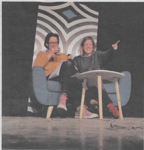
La représentation aura lieu le 9 mars

C'est à partir de ce qui pourrait apparaître comme une